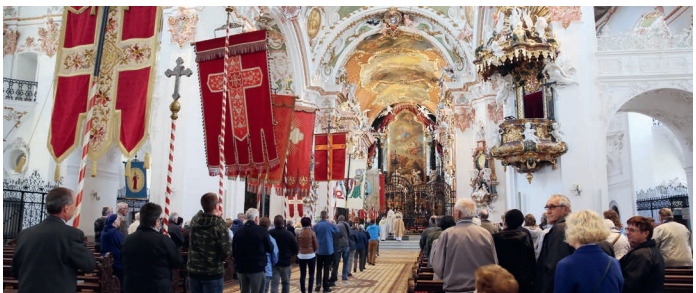
Feierlicher Einzug der Pfarrefahnen im Rahmen der Wallfahrt der Bezirke Schwyz, Küssnacht und Gersau – in diesem Jahr am 16. Mai.