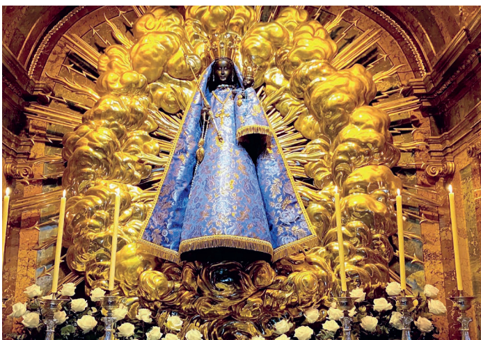
Die Schwarze Madonna im sogenannten «Zuger-Kleid». Am 14. Mai 2026 findet die Zuger Ständeswallfahrt zum 600. Mal statt.

Täglich in der Unterkirche (Eingang in der Klosterkirche vorne links) jeweils 13.15–16.00 Uhr. Um 16.00 Uhr Andacht mit Eucharistischem Segen.