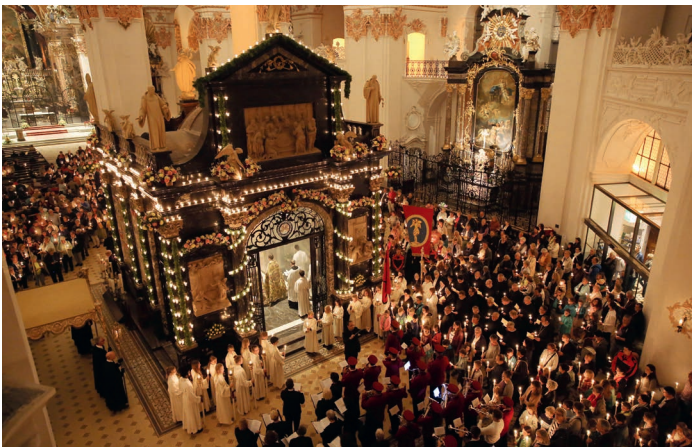
Impression vom Weihefest der Gnadenkapelle am 14. September