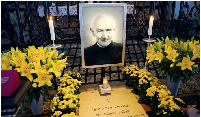
Grabstätte von Bruder Meinrad Eugster (1848–1925) in der Klosterkirche