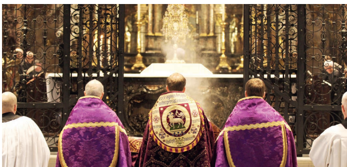
Eucharistische Anbetung in der Vesper an den Einsiedler Betsontagen