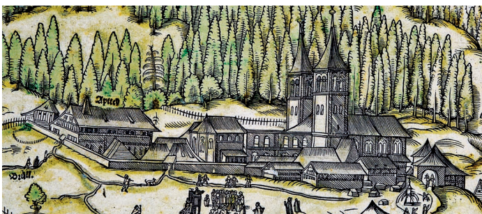
Holzschnitt mit ältester Darstellung des Klosters Einsiedeln (vor 1509)

Auf diesem Weg ist uns die jungfräuliche Gottesmutter Maria eine wunderbare Wegbegleiterin. Sie, deren Herz jenem ihres göttlichen Sohnes am ähnlichsten war, hilft uns als unsere himmlische Mutter, uns Jesus Christus immer mehr anzugleichen. Aus diesem Grund gehören die Feier der Sakramente der Eucharistie und der Versöhnung stets zur «spirituellen Grundversorgung» in einem Marienheiligtum. Die täglich mindestens vier heiligen Messen und drei Stunden Beichtgelegenheit im Kloster Einsiedeln sind eine Einladung an alle, sich durch die Begegnung mit Jesus Christus erneuern zu lassen.